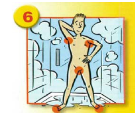
Insister sur : les aisselles, le nombril, les plis de l'aîne et les pieds.