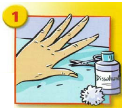
Enlever le vernis, couper et curer les ongles. Enlever les bijoux