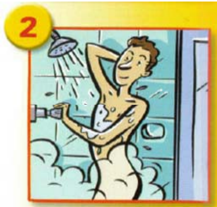
Se mouiller le corps et les cheveux.