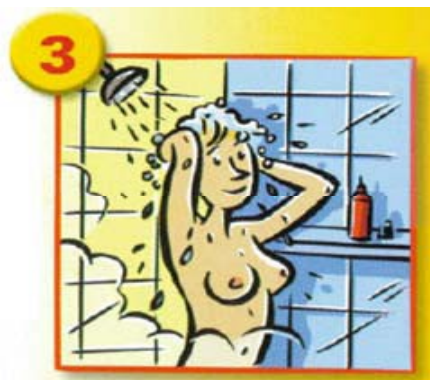
Appliquer le savon antiseptique en commençant par les cheveux.