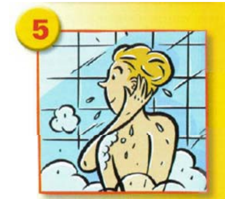
Laver le visage et le cou en insistant derrière les oreilles.